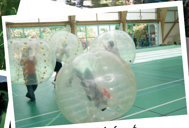
Bubblefoot 21 mai 2017