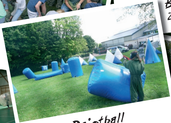
Paintball 21 mai 2017